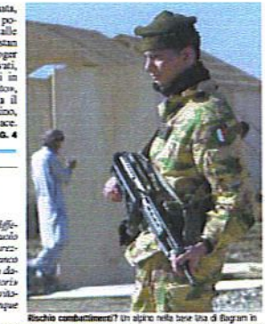
Alpini combattenti? Un alpino nella base Usa di Bagran in Afghanistan. Polmone sul retro del contingente italiano.

libera russa a un'azione armata, se decisa dall'Onu. È intanto politica in Italia in seguito alle dichiarazioni dall'Afghanistan del portavoce americano Roger King: gli alpini appena arrivati, ha detto, saranno impegnati in pesanti operazioni di combattimento nella regione di Khost. Ma, il ministro della Difesa, Martino, assicura: è una missione di pace. SERVIZIO A PAG. 4