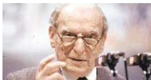
CONTINUA A PAG. 8

ta e nutrita dagli affetti della famiglia e degli amici, dalla passione per lo studio e per la divulgazione didattica, dall'impegno civile a favore del nostro Paese: cioè di noi stessi. Tra le sue molte identità — lo studioso, il professore, l'intellettuale impegnato, il marito, il padre, l'interlocutore e amico — nessuna prevaleva, nessuna soffocava le altre.