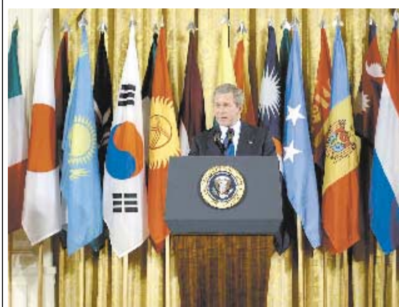
Un anno dopo la guerra. Mentre George Bush da Washington ha rinnovato l'appello all'unità degli alleati contro il terrorismo...

Bush: alleanza contro il nemico-terrorismo