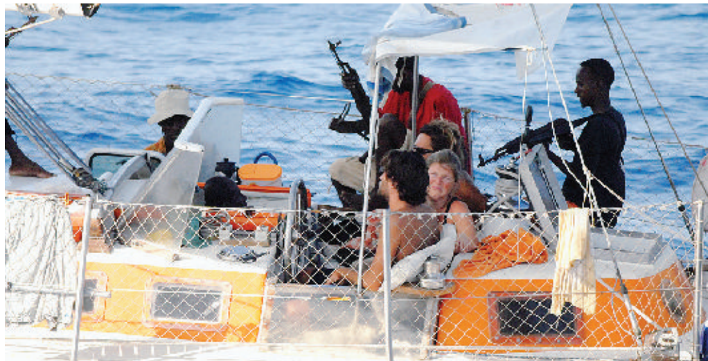
Pirati tengono in ostaggio turisti. Nel Golfo di Aden sei attacchi in sette giorni. Molinari e Stabile ALLE PAG. 2 E 3

Paura per dieci connazionali La Difesa invia una fregata