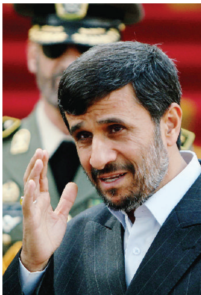
Ahmadinejad aspetta gesti concreti dagli Usa