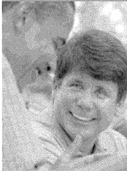
Barack Obama con il governatore dell'Illinois Rod Blagojevich