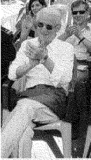
Il Trap ieri a Sestri Levante