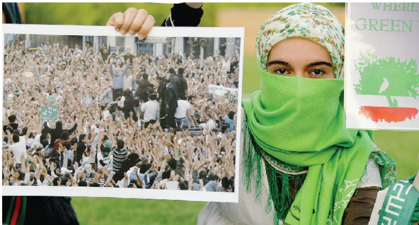
Una sostenitrice di Mousavi mostra un'immagine della manifestazione di lunedì a Teheran Masliah, Molinari e Stabile DA PAG. 2 A PAG. 5