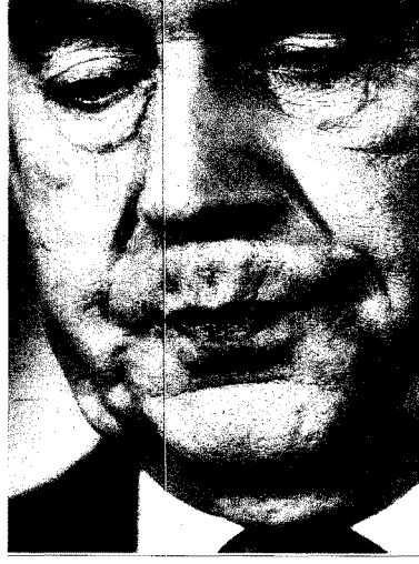
Disfatta elettorale. Sei ministri hanno lasciato il governo, i laburisti sono stati sconfitti nel voto amministrativo

Brown perde sei ministri ma non si dimette