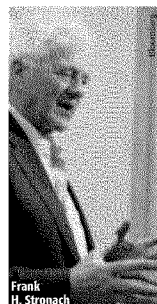
Frank H. Stronach