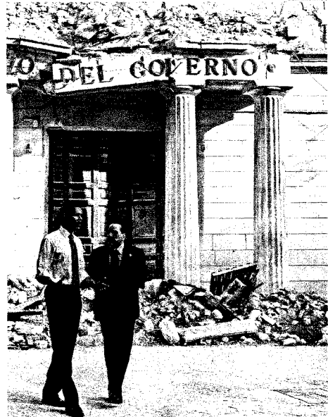
«Grande leadership del governo italiano». Barack Obama e Silvio Berlusconi davanti alla prefettura dell'Aquila

Il primo via libera alle nuove regole è al global standard legale ed etico di vigilanza per evitare future crisi è arrivato ieri dai summit degli Otto grandi riuniti all'Aquila. Soddisfazione del premier Silvio Berlusconi, che ha anche accompagnato il presidente Usa Barack Obama e altri leader in visita fra le rovine del terremoto: «La crisi è, per la parte più dura, alle nostre spalle e ora i governi lavoreranno in maniera coordinata anche sulle nuove regole globali». Ottimista sulla ripresa il Fondo monetario internazionale, che ha aggiornato dopo due anni le previsioni sulla crescita: +0,1% nel 2009 +2,5% nel 2010.