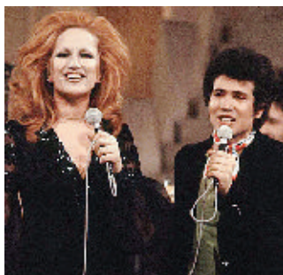
Mina e Lucio Battisti a Teatro 10

Alle 21,47, scatta l'ora di un evento eccezionale nella storia della televisione italiana, quindi della società italiana: per la prima, unica e ultima volta