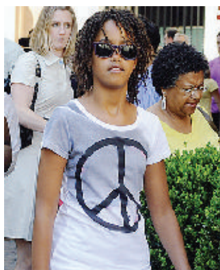
Malia Obama a Roma