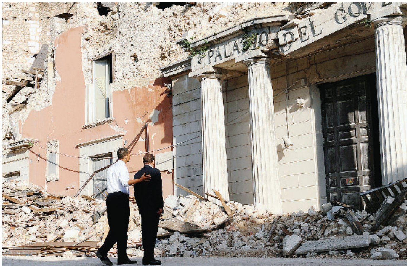
Obama e Berlusconi davanti alla prefettura dell'Aquila distrutta dal sisma del 6 aprile DA PAG. 2 A PAG. 11 E UN COMMENTO DI Mario Tozzi A PAG. 25