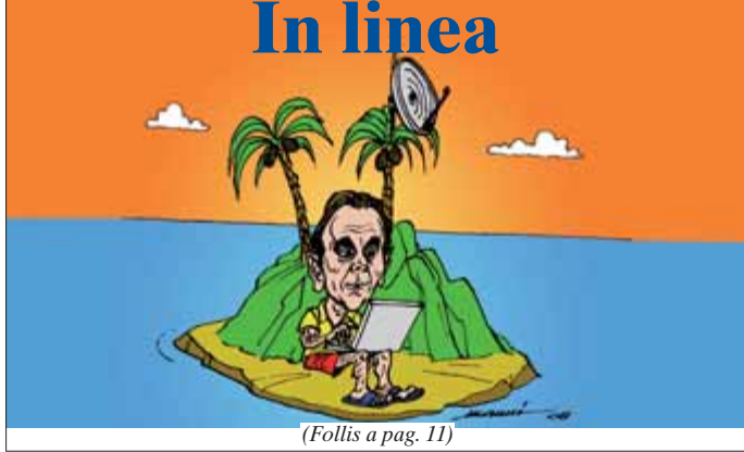
(Follis a pag. 11)