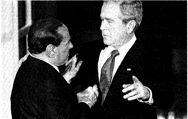
Alletti. «Con Obama avrò lo stesso rapporto che ho avuto con Bush»

Accordo al G-20 di Washington per misure coordinate di stimolo all'economia e per regole più stringenti sui mercati finanziari.