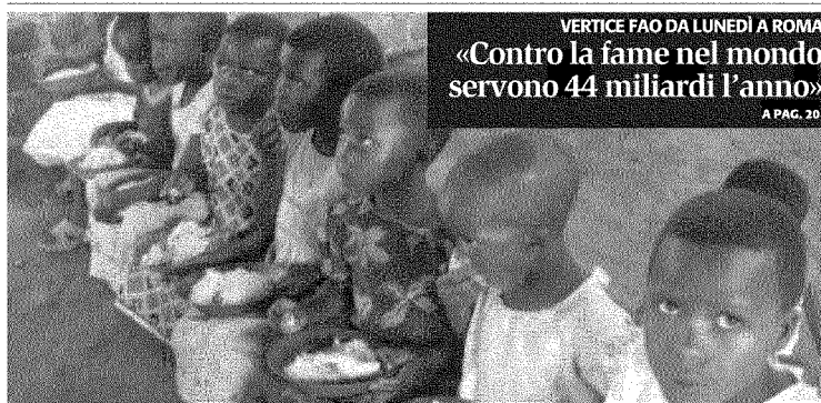
VERTICE FAO DA LUNEDÌ A ROMA «Contro la fame nel mondo servono 44 miliardi l'anno»