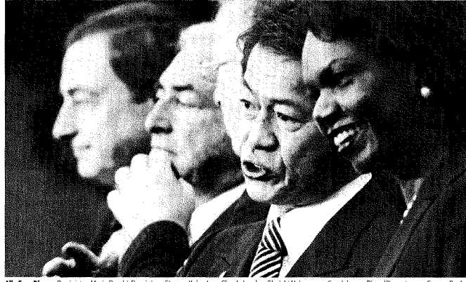
Alla Casa Bianca. Da sinistra: Mario Draghi, Dominique Strauss-Kahn, Jean-Claude Juncker, Shinichi Nakagawa e Condoleezza Rice all'incontro con George Bush.

LIQUIDITÀ D'ora in poi le operazioni di rifinanziamento del mercato monetario vengono effettuate dalla Bce a tasso d'interesse fisso, non più variabile, e per un ammontare senza limiti.