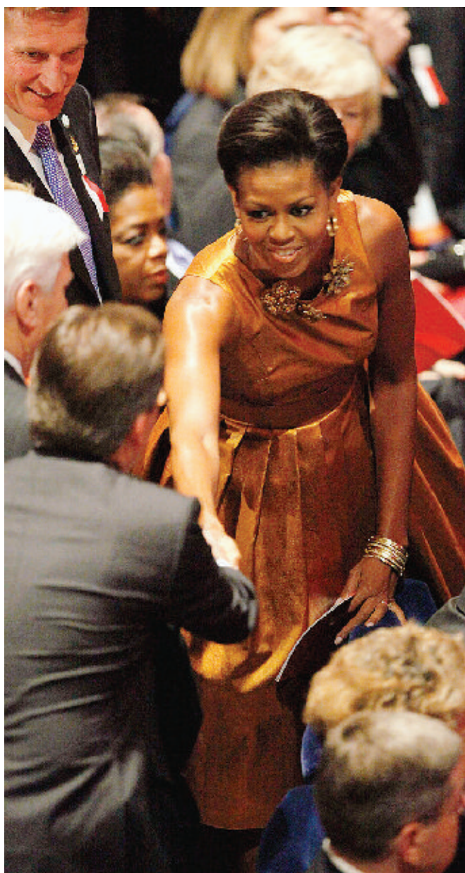
La moglie di Obama all'Opera House Molinari e Zonca PAG. 12-13