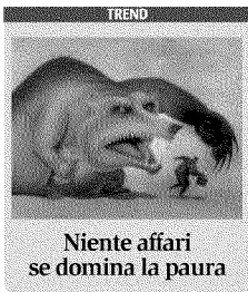
Niente affari se domina la paura

Piazza Affari trema. Poi il calo dei tassi dà ossigeno a bancari e assicurativi A PAG. 3