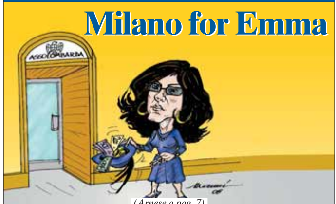
(Arnese a pag. 7)

Da Assolombarda a Confindustria arrivano 3,4 milioni