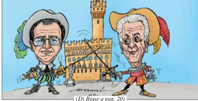
(Di Biase a pag. 20)

LA QUOTA NASDAQ FINIRÀ NEGLI EMIRATI DOPO LE POLEMICHE CHE HANNO MESSO FUORI GIOCO LE FONDAZIONI