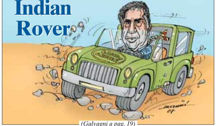
(Galvagni a pag. 19)

CAPROTTI CONFIDA A MFL LA SUA INTENZIONE. E SI AVVENTA SULLE COOP CON UN VOLUME ALVETRIOLO