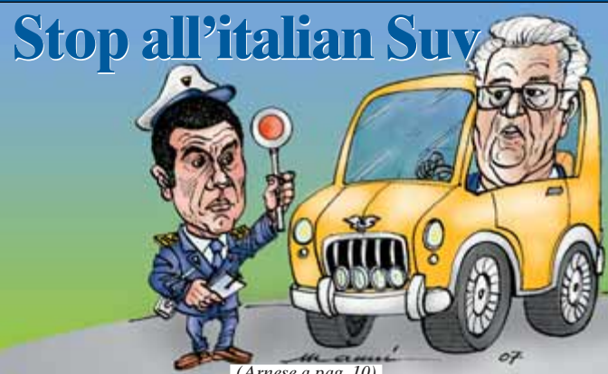
(Arnese a pag. 10)

OCSE Danni da mutui anche in Italia Tagliato il Pil (Nido a pag. 4)