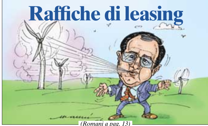
(Romani a pag. 13)