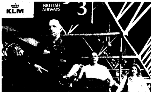
Il grande allarme. Un poliziotto armato di guardia, ieri mattina al terminal 4 dell'aeroporto di Heathrow