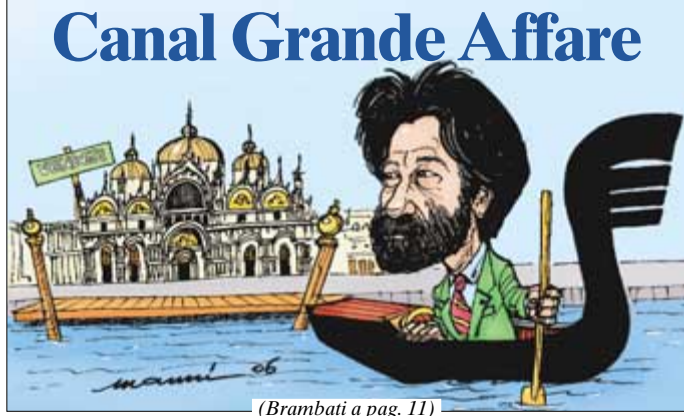
(Brambati a pag. 11)