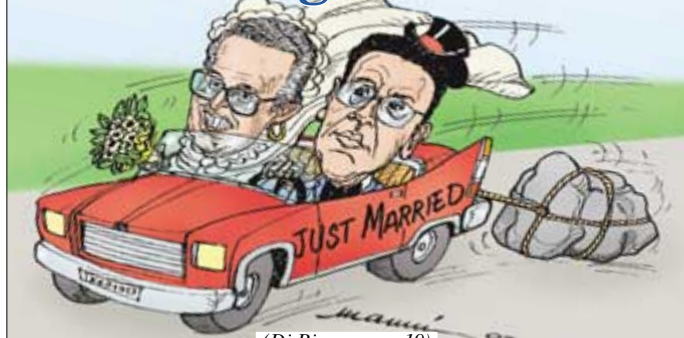
(Di Biase a pag. 19)

PRODI PASSA AL SENATO. MA SENZA DI LORO LA RICHIESTA DEL QUIRINALE SAREBBE STATA INEVASA