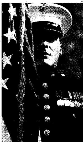
Minacce da al-Qaida. A cinque anni dalle stragi dell'11 settembre... (nella foto, commemorazione al consolato Usa di Bruxelles)...