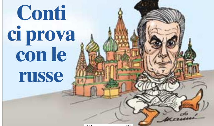
(Zoppo a pag. 7)

L'a.d. Enel a Mosca, contatti con quattro società